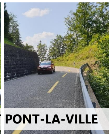
LE SENTIER DU LAC DE LA GRUYERE